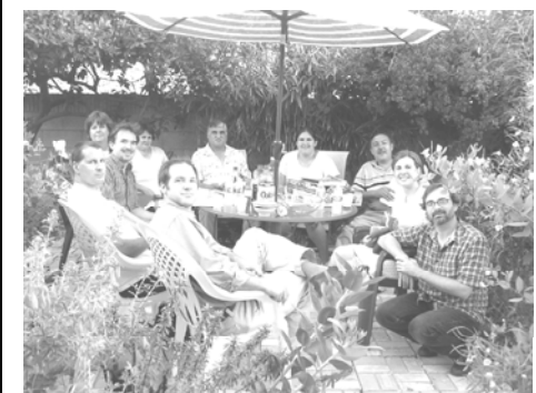
Monthly meetings are a nice time to see your neighbors and plan ways to improve the neighborhood.

ក៏ដូចជាក្នុងករណីនៃតំបន់ប្រវត្តិសាស្ត្ររបស់ទីក្រុងឡងប៊ីច, ថ្នាក់សញ្ញានេះគឺធ្វើយ៉ាងណាឲ្យគេដឹងពីតំបន់ប្រវត្តិសាស្ត្រ របស់យើងដែលមាននៅក្នុងទីក្រុងឡងប៊ីច។ យើងមិនមានអ្វីកើតឡើងដូចពីមុននោះទេ ព្រោះអ្នកលក់ផ្ទះគេច្រើន និយាយគេមិនបានដឹងថាផ្ទះនោះស្ថិតនៅក្នុងតំបន់ប្រវត្តិសាស្ត្រនោះឡើយ! ថ្នាក់សញ្ញានេះអាចបញ្ជាក់ធ្វើឲ្យអ្នកភូមិមាន មោទនភាពថាគេកំពុងរស់នៅក្នុងតំបន់ប្រវត្តិសាស្ត្រ។ យើងសូមអរគុណយ៉ាងខ្លាំងចំពោះលោកអ្នកដែលធ្វើការជាច្រើនឆ្នាំដើម្បីទទួលនូវថ្នាក់សញ្ញានេះ។